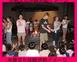
※異文化体験活動イメージ

参加者・リーダー両方による特技披露や、各国の民族衣装を身にまとうてダンスを楽しみながら各国の伝統文化に触れます。