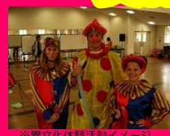
※異文化体験活動イメージ