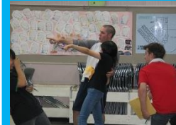
※英語活動イメージ

日常生活やキャンプでの体験、映画のワンシーン等から英語劇をリーダーと一緒に作り、発表会で発表します。